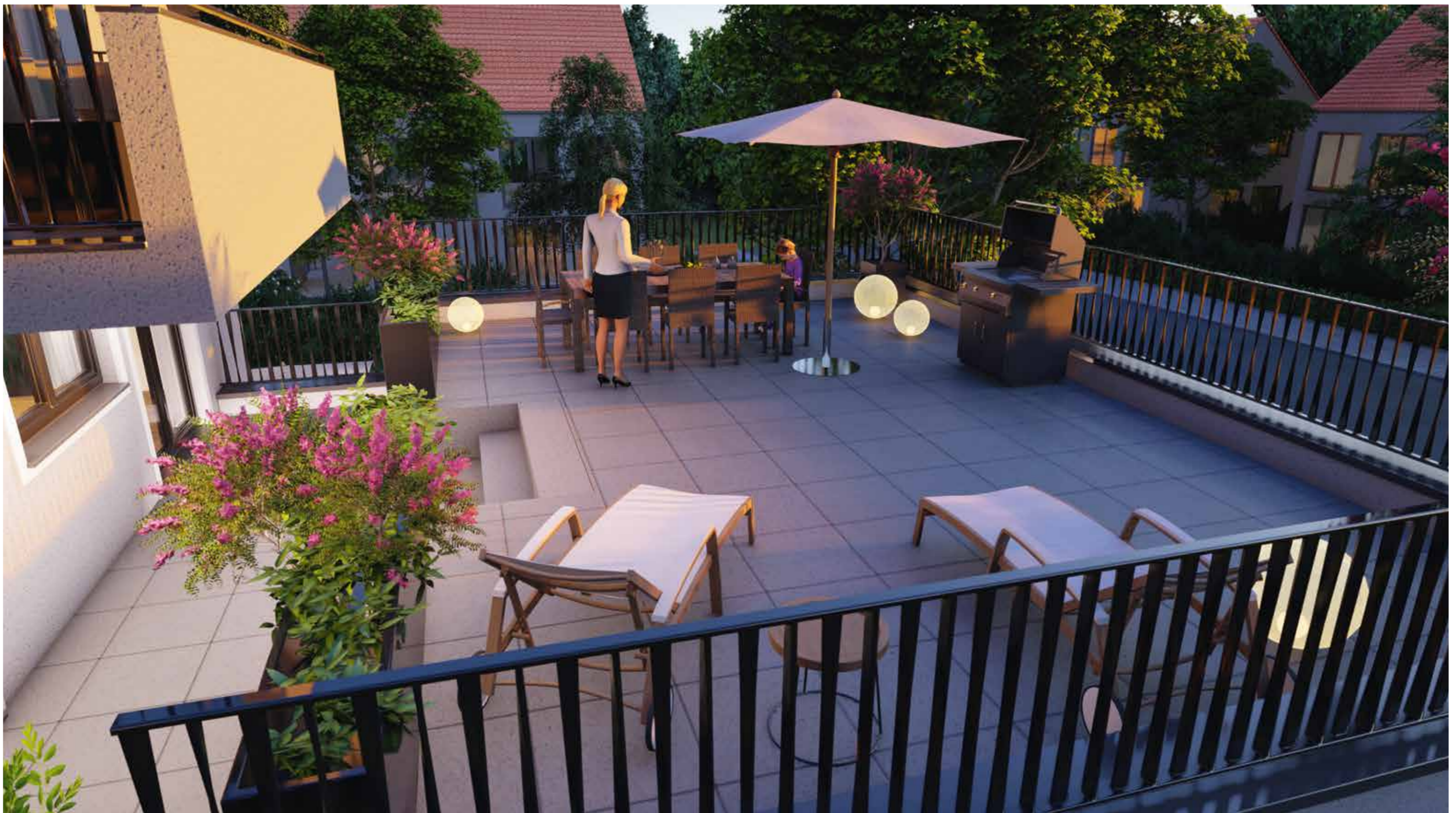
Darstellung aus Sicht des Illustrators - Dachterrasse Wohnung 4

Generell: Die Flächen der außerhalb der Wohnungen liegenden Abstellräume im KG sind nicht angerechnet. Abmauerungen, Mauervorlagen, Kamine, Versorgungsschächte etc. bis zu 0,5 m 2 pro Einzelfall sowie geringfügige Änderungen, z. B. aufgrund der Baugenehmigung, neuer statischer, schall- oder wärmeschutztechnischer Erfordernisse sowie Grundrissänderungen und Sonderwünsche der Käufer sind in den Berechnungen nicht berücksichtigt, sie bleiben vorbehalten und können die Flächenberechnung verändern.