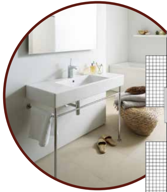
Die Abbildung ist ein Produktfoto von Duravit und zeigt die Designserie Vero.