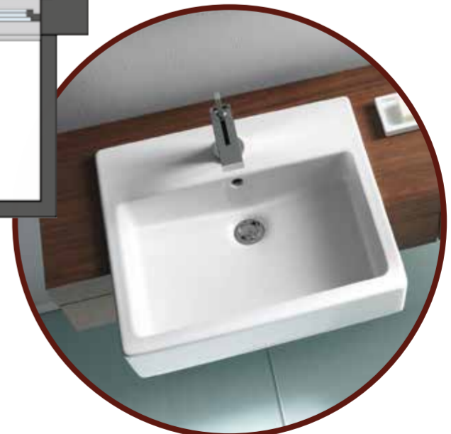
Die Abbildung ist ein Produktfoto von Duravit und zeigt die Designserie Vero.

Nutzbare Fläche: Grundlage der Berechnung der Nutzbaren Fläche sind die Rohbau-Planmaße. Bei der Ermittlung wurden die Grundflächen der Wohnungen zu 100% angerechnet. Ebenfalls zu 100% angerechnet sind die Flächen der direkt mit den Wohnungen 1 und 2 verbundenen Räume im Souterrain sowie die separaten Hobbyräume 7 und 8. Terrassen, Balkone und Dachterrasse sind zu 100% in der nutzbaren Fläche enthalten. Die Grundflächen der Dachgeschoss-Wohnungen sind bis zu einer Raumhöhe von 0,50 m angerechnet.