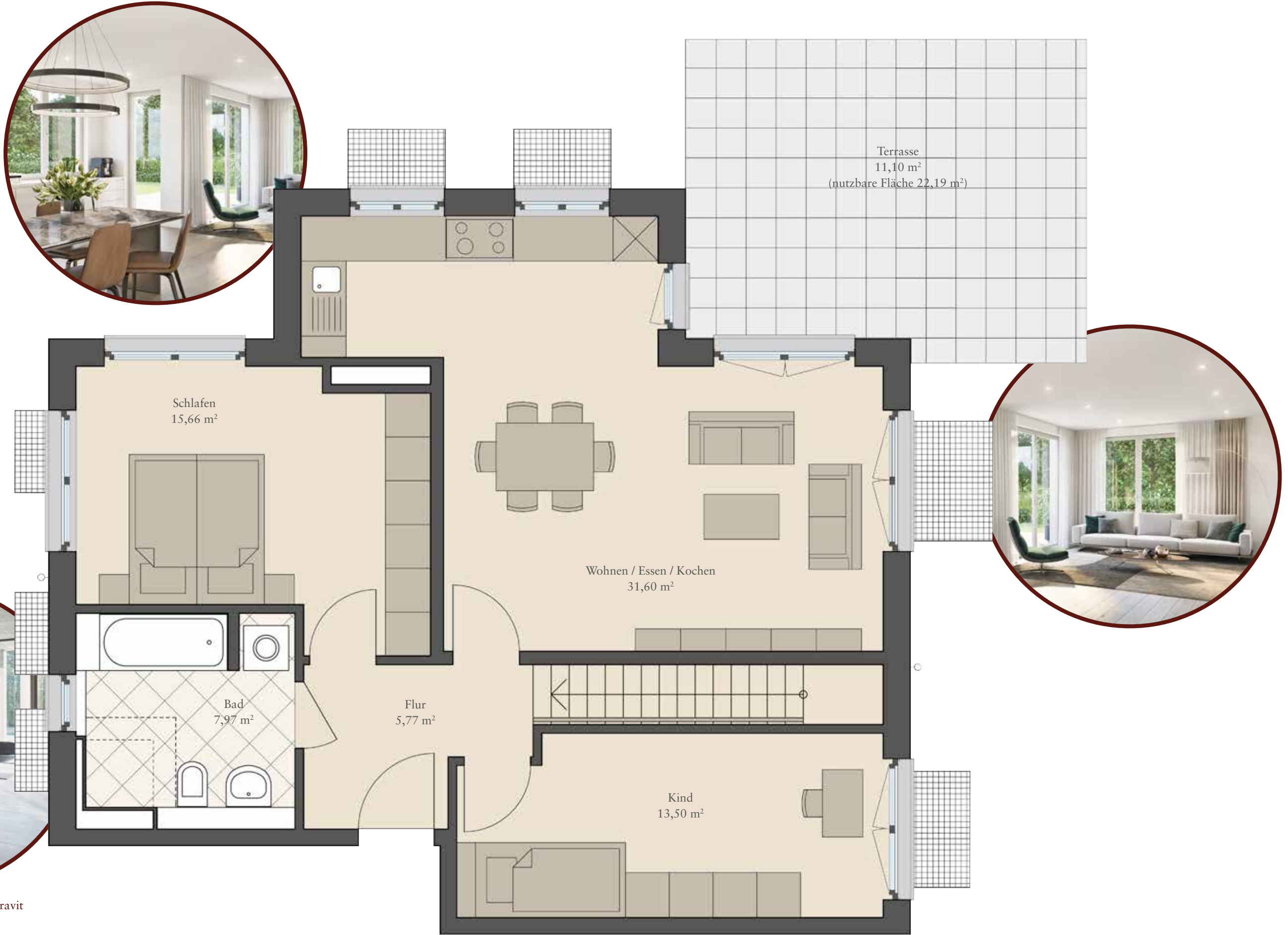
Die Abbildung ist ein Produktfoto von Duravit und zeigt die Designserie Vero.